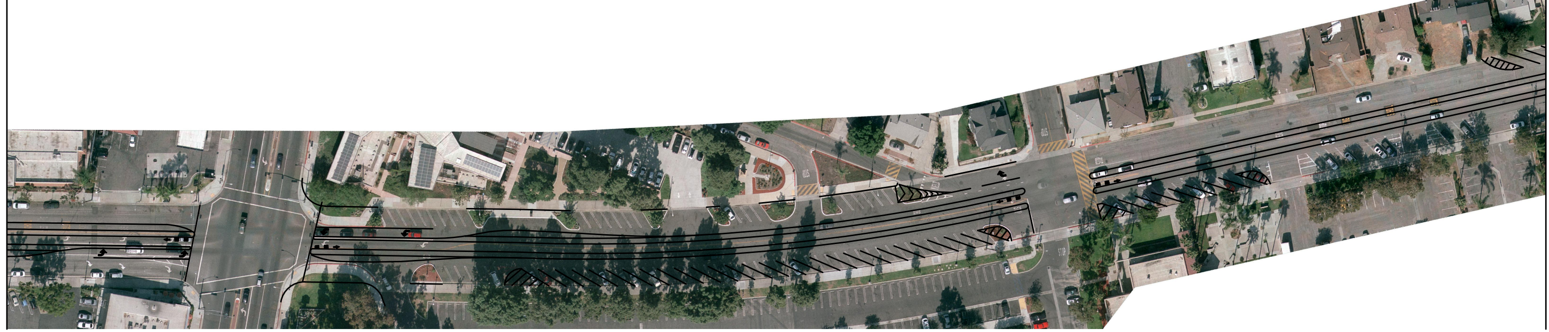
MINES AVENUE FROM 300' E/O MANZANAR AVENUE TO 500' E/O LINDSEY AVENUE

MINES AVENUE FROM PARAMOUNT BOULEVARD TO 300' E/O MANZANAR AVENUE